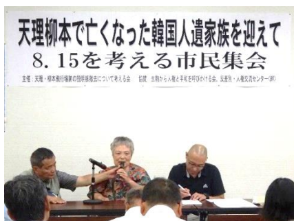
天理柳本で亡くなった韓国人遺家族を迎えて 8.15を考える市民集会

飛行場建設は「本土決戦」を想定し進められた。「米軍が最も上陸しにくい場所に拠点を置く」として、陸軍は八尾飛行場、海軍は柳本飛行場を造った。天